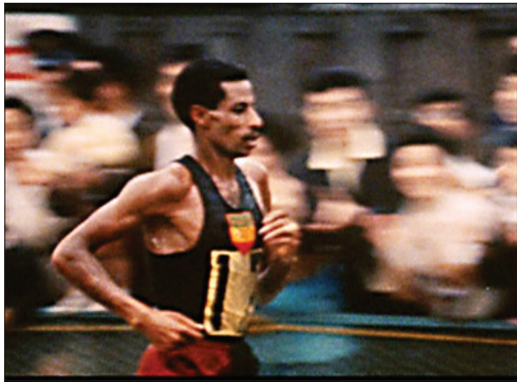
Nella foto, Abele Bikila durante la maratona di Roma alle Olimpiadi del 1960. Al centro a destra, un frame tratto dal corto "Rita"

Empire State Building, Chrysler Building, George Washington Bridge, World Trade Center: per oltre 120 anni sei generazioni di indiani Mohawk hanno disegnato l'attuale